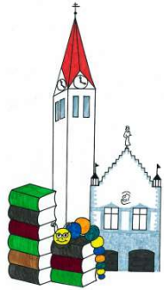
Kath. öffentl. Bücherei St. Zeno Isen